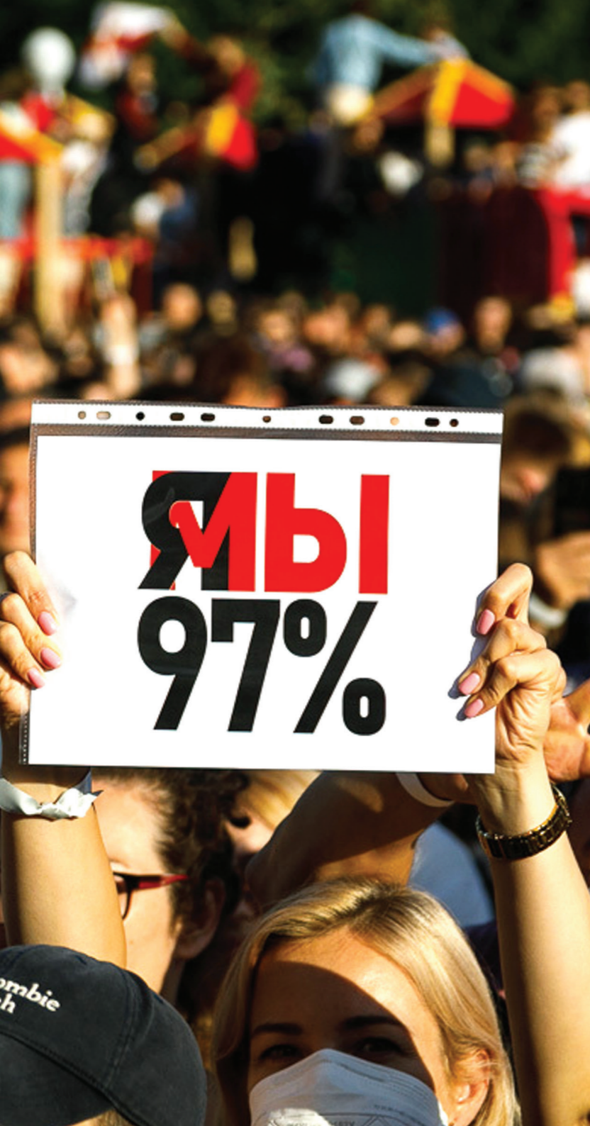
Вольга Шукайла, TUT.BY