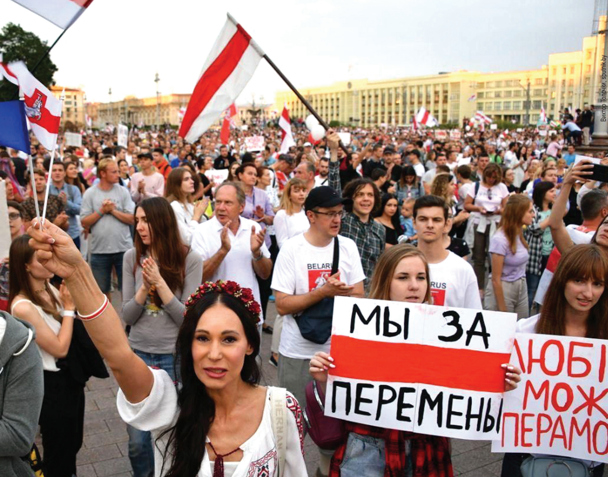
Виктор Топочки, Sputnik.by