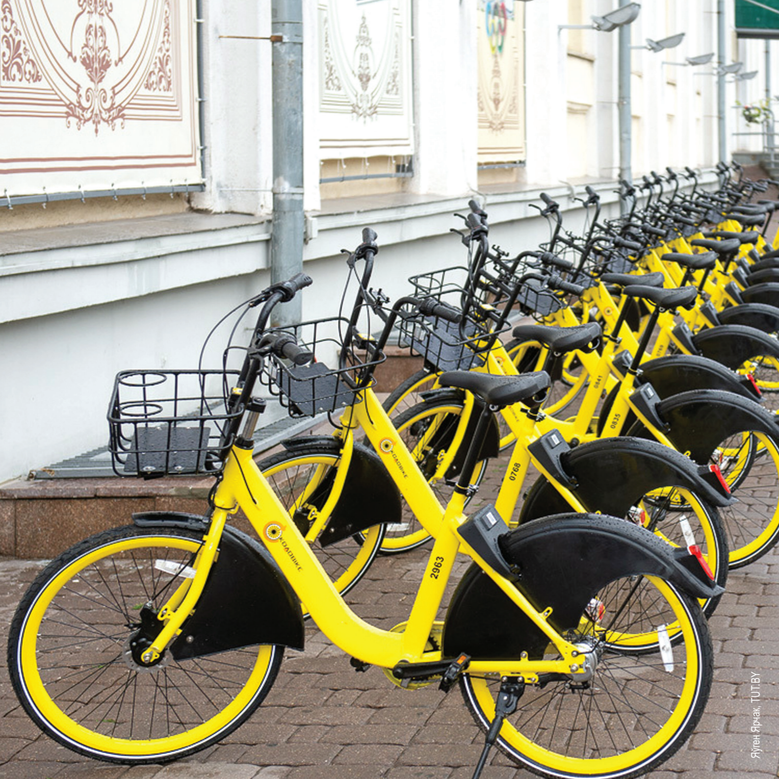
Яўген Ярчак, TUT.BY