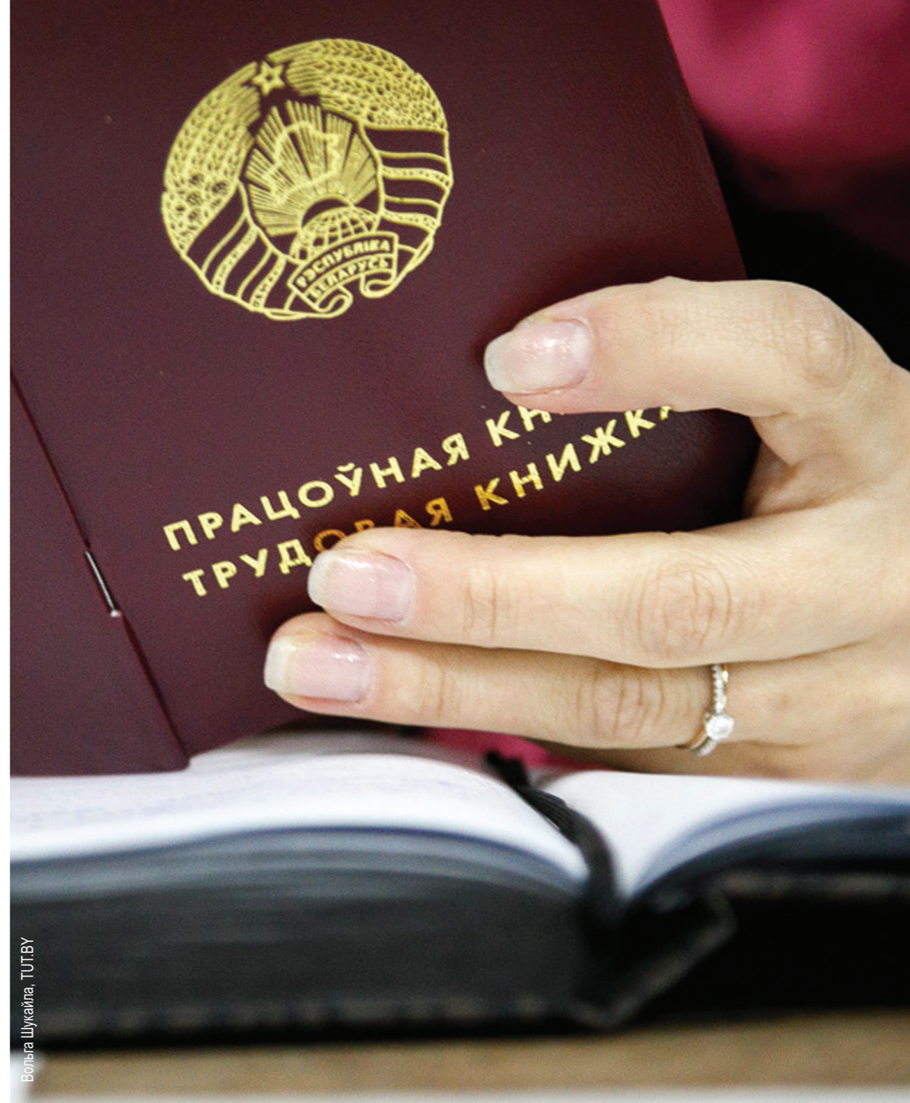
Вольга Шукайла, TUT.BY

– Палітыка ўрада ў галіне стварэння і захавання працоўных месцаў засяроджваецца на падтрымцы буйных прадпрыемстваў дзяржаўнай формы ўласнасці з дапамогай грашовых уліванняў, хоць рэсурсы ў дзяржавы ва ўмовах эканамічнага крызісу скарачаюцца.